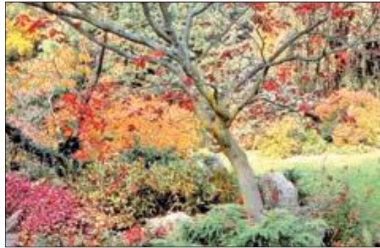
Farbfeuerwerk: Das Herbstgewand des Fächer-Ahornes verleiht den Abschied vom Sommer.